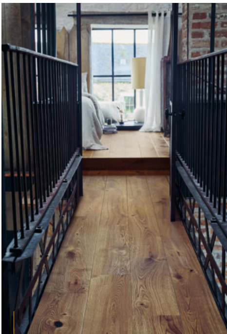
Chêne | Héritage | Huile Cuic | Diva 184