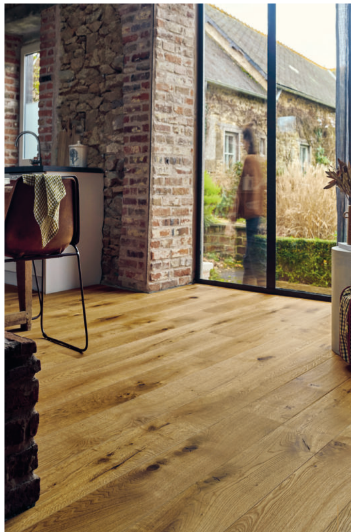
Chêne | Héritage | Huile Naturelle | Diva 184

Inspiré des planchers d'autrefois, le parquet Héritage est fabriqué à partir d'un choix de bois très marqué. Ces traces que le temps a laissées dans le chêne tout au long de sa croissance sont autant de richesses offertes à ce nouveau parquet. En effet, les lames Héritage portent en elles de nombreuses et fortes singularités : nœuds noirs, nœuds bouchés ou partiellement ouverts, nuances et discolorations, fentes, traces de cœur... elles accentuent l'authenticité et le naturel du parquet.