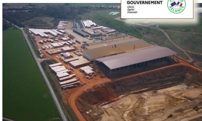
Site de MABLY